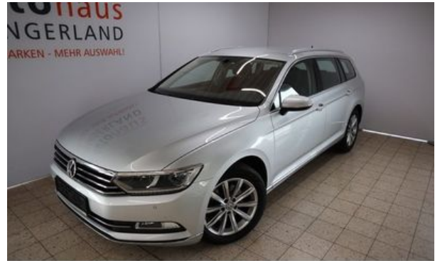
Autohaus Wangerland – Mehr Marken, mehr Auswahl

Fahrzeug-Nr: 9822 Erstzulassung: 12.2015 Leistung: 110 kW km-Stand: 87.000 km Hubraum: 1.968 ccm Farbe: Reflexsilber metallic Getriebe: Automatik Kraftstoffart: Diesel Schwackecode: 10529651 Hersteller-Nr.: 603 Typ-Schlüssel: BQS