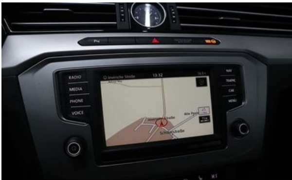
Autohaus Wangerland - Mehr Marken, mehr Auswahl