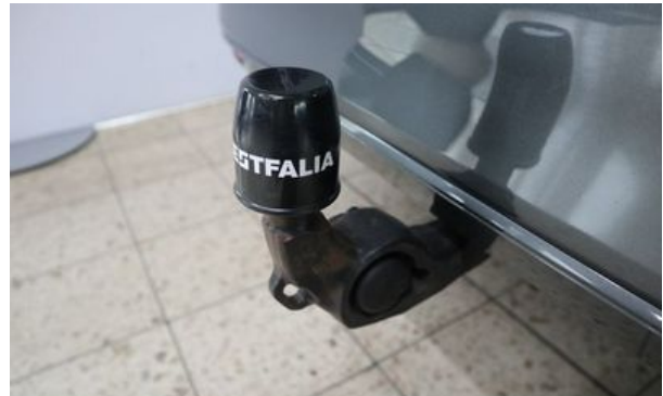
Autohaus Wangerland - Mehr Marken, mehr Auswahl