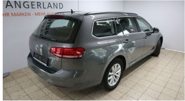
Autohaus Wangerland - Mehr Marken, mehr Auswahl