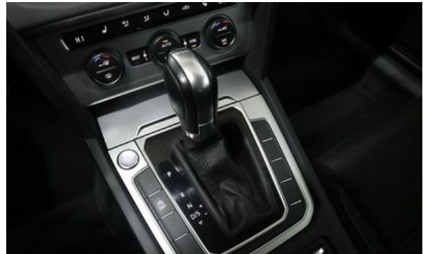
Autohaus Wangerland - Mehr Marken, mehr Auswahl