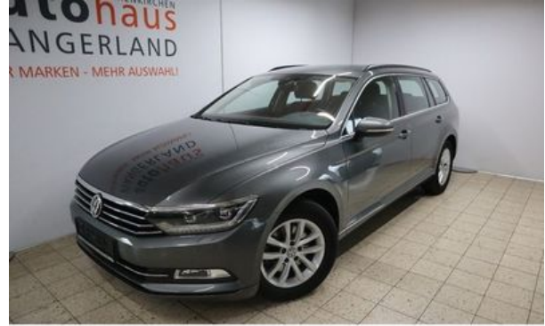
Autohaus Wangerland – Mehr Marken, mehr Auswahl

Fahrzeug-Nr: 8764 Erstzulassung: 07.2015 Leistung: 110 kW km-Stand: 89.000 km Hubraum: 1.968 ccm Farbe: Indiumgrau metallic Getriebe: Automatik Kraftstoffart: Diesel Schwackecode: 10529631 Hersteller-Nr.: 603 Typ-Schlüssel: BQS