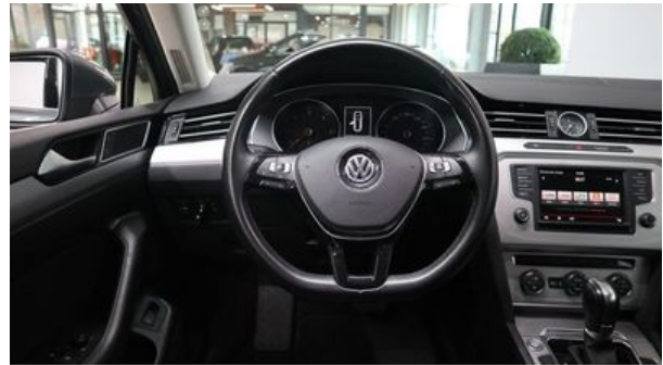
Autohaus Wangerland - Mehr Marken, mehr Auswahl