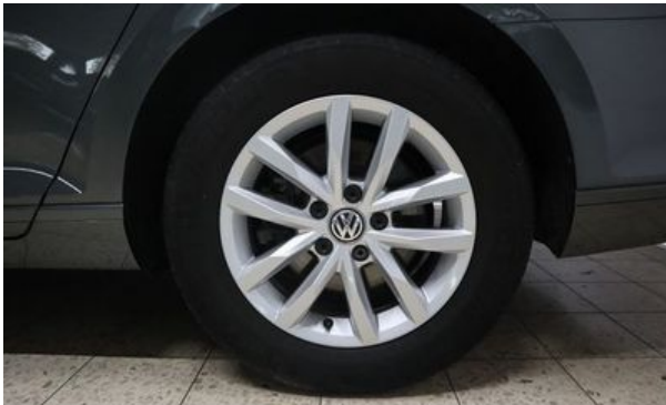
Autohaus Wangerland - Mehr Marken, mehr Auswahl