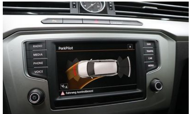
Autohaus Wangerland - Mehr Marken, mehr Auswahl