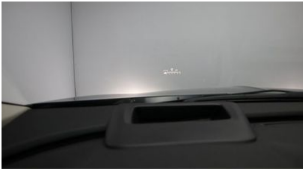
Autohaus Wangerland - Mehr Marken, mehr Auswahl

Tel: +49 - (0)4463 / 5888 Fax: +49 - (0)4463 / 1320 E-Mail info@autohaus-wangerland.de