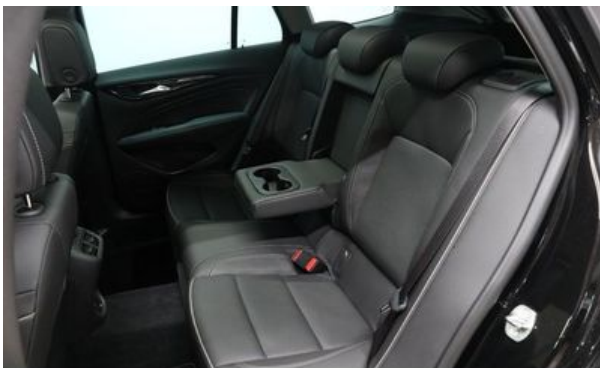
Autohaus Wangerland - Mehr Marken, mehr Auswahl