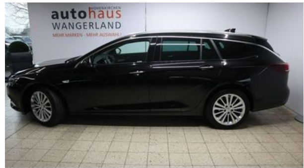
Autohaus Wangerland - Mehr Marken, mehr Auswahl