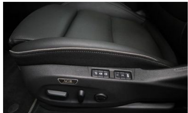
Autohaus Wangerland - Mehr Marken, mehr Auswahl