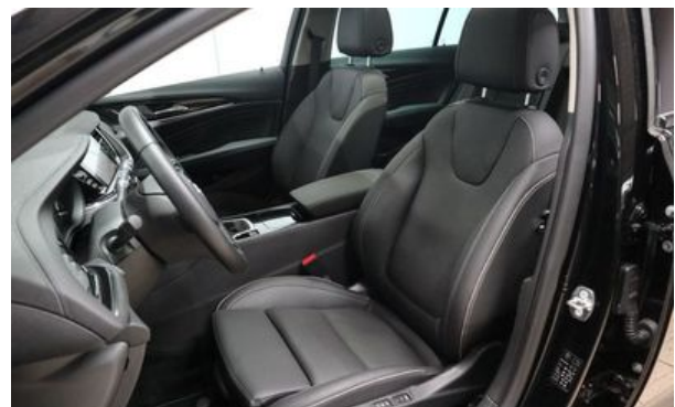
Autohaus Wangerland - Mehr Marken, mehr Auswahl