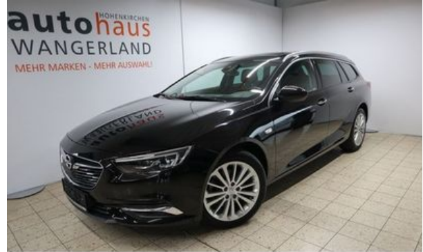
Autohaus Wangerland – Mehr Marken, mehr Auswahl

Fahrzeug-Nr: 2551 Erstzulassung: 09.2017 Leistung: 125 kW km-Stand: 11.000 km Hubraum: 1.956 ccm Farbe: Onyx Schwarz metallic Getriebe: Schaltgetriebe Kraftstoffart: Diesel