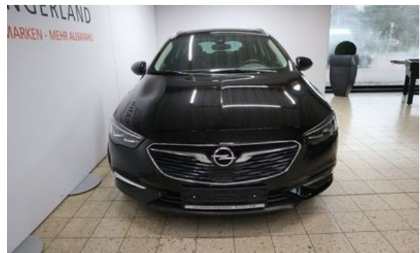
Autohaus Wangerland - Mehr Marken, mehr Auswahl