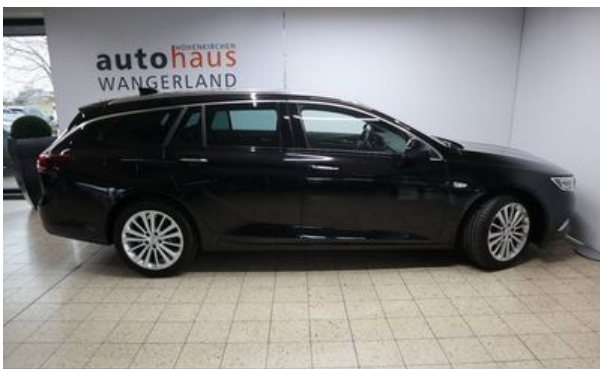
Autohaus Wangerland - Mehr Marken, mehr Auswahl