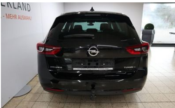
Autohaus Wangerland - Mehr Marken, mehr Auswahl