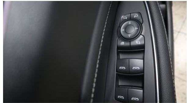
Autohaus Wangerland - Mehr Marken, mehr Auswahl