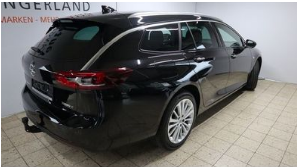
Autohaus Wangerland - Mehr Marken, mehr Auswahl

Tel: +49 - (0)4463 / 5888 Fax: +49 - (0)4463 / 1320 E-Mail info@autohaus-wangerland.de