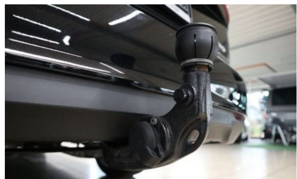
Autohaus Wangerland - Mehr Marken, mehr Auswahl