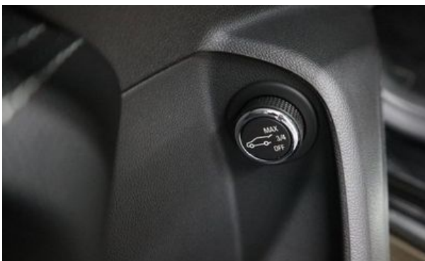
Autohaus Wangerland - Mehr Marken, mehr Auswahl