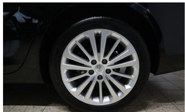
Autohaus Wangerland - Mehr Marken, mehr Auswahl